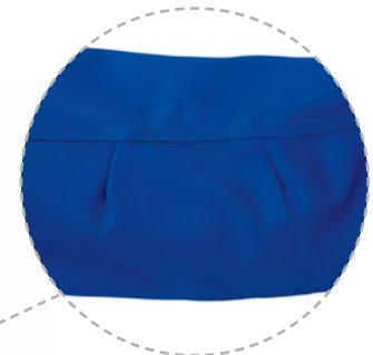
Ergonomisch geformte Ärmel.