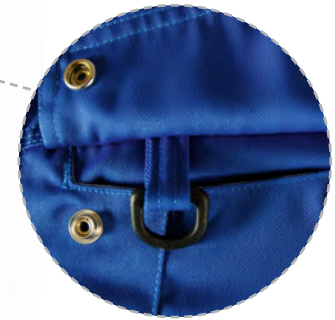
D-Ring unter der rechten Brusttaschenpatte.